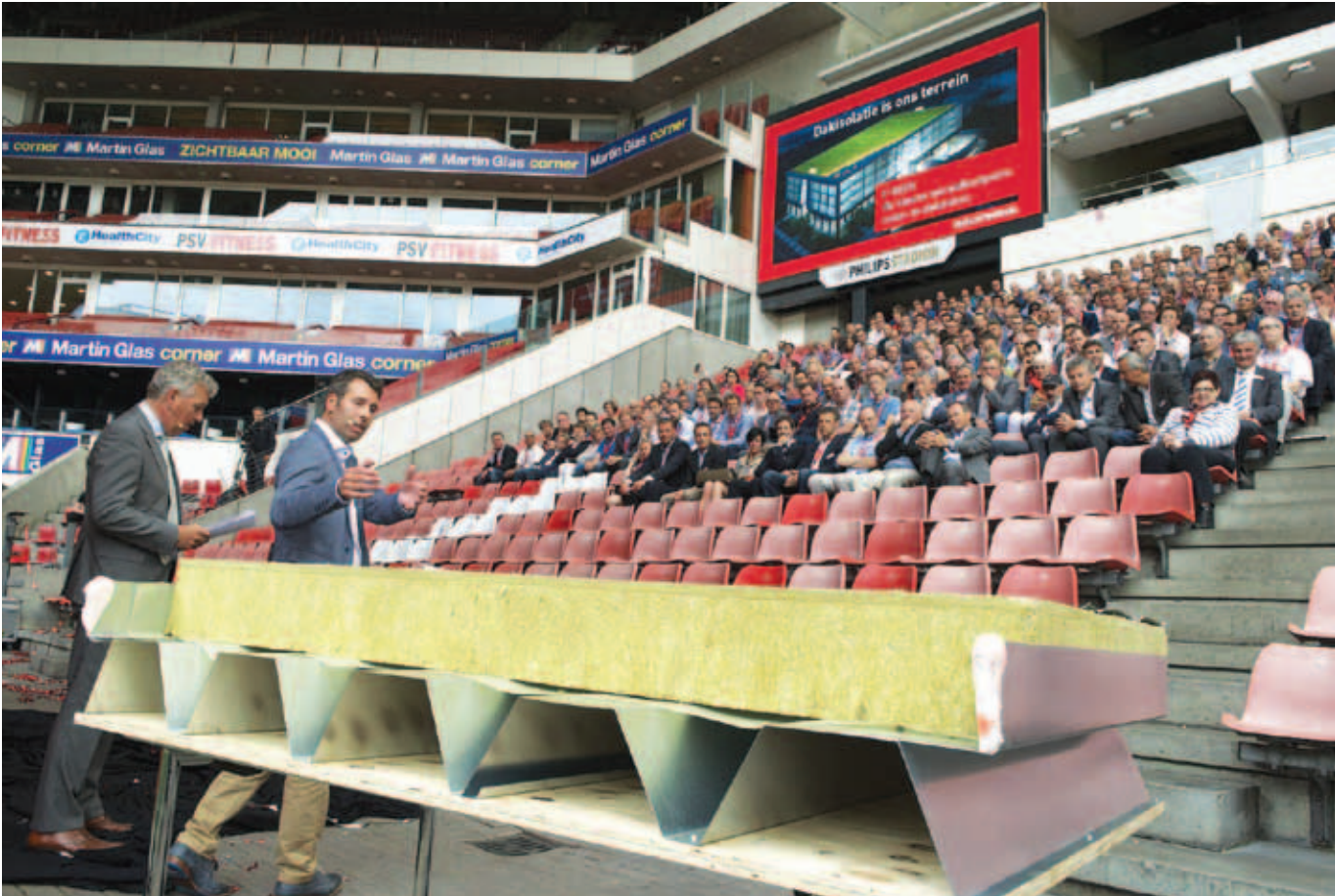
Op 21 mei werd de nieuwe dakplaat T-Rock onder grote belangstelling gelanceerd in het Philips Stadion.