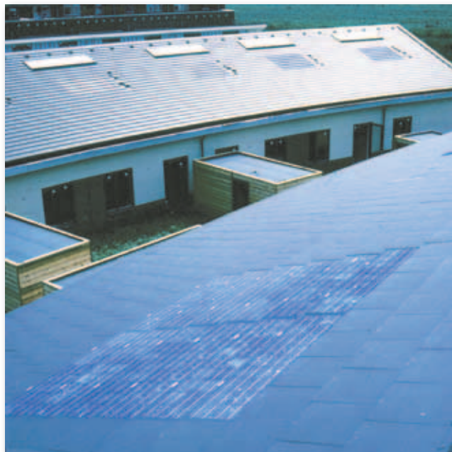
Een goede en mooie oplossing: het PV systeem is tussen de dakpannen in het dak geïntegreerd.

De ontwikkeling van regelgeving en richtlijnen op het gebied van zonnepanelen heeft al een lang traject achter de rug. Op Europees niveau wordt al sinds 1999 aan normering gewerkt. Elke lidstaat heeft de vrijheid de Europese richtlijn op de eigen manier in te vullen, in Nederland moet dit traject leiden tot een herziening van de NEN-norm NEN 7250 'Zonne-energiesystemen - Integratie in daken en gevels - Bouwkundige aspecten'. Vooruitlopend op de introductie van de NEN 7250 loopt de ontwikkeling van de BRL 9933 'Montage van PV-panelen en zonnecollectoren' en de ontwerprichtlijn BRL 9931 'Componenten van zonne-energiesystemen'. Op deze manier wordt de kwaliteit van de gehele keten (ontwerp - componenten - montage) geborgd.