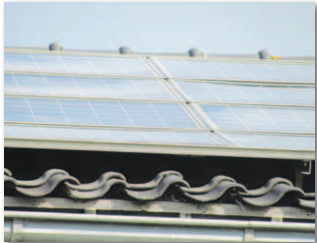
Systeem golft over het dak.